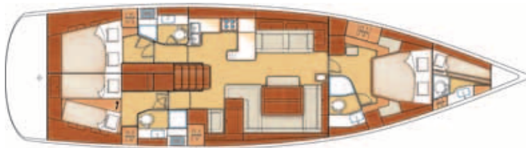
3-cabin version + Stem cabin 3 cabines + cabine d'étrave